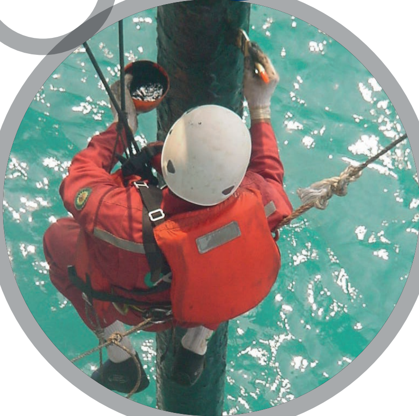
Ремонт морского стояка