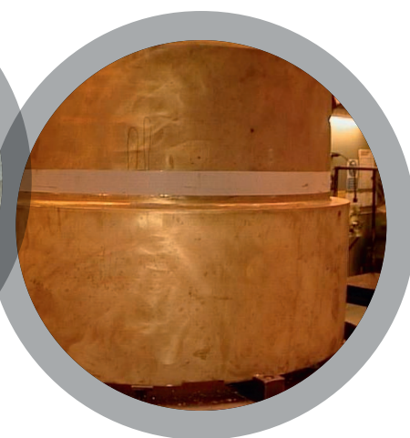
Восстановление гидравлического поршня