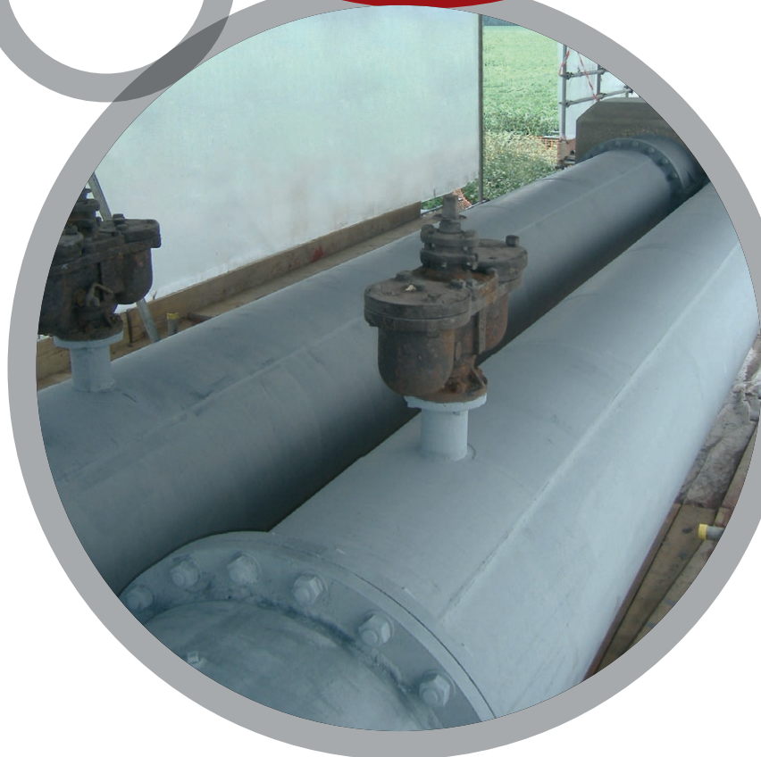
Приклеивание металлических заплаток

За более детальной информацией обратитесь к местному представителю Belzona: