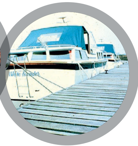
Ремонт повреждённого стеклопластика