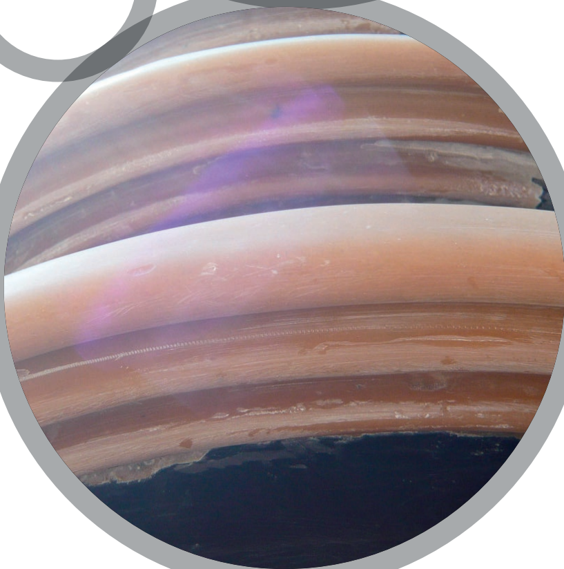
Ремонт фарфоровых изоляторов

За дополнительной информацией обратитесь к: Belzona Технические характеристики продукта Belzona Инструкция по применению Belzona KNOW-HOW In Action