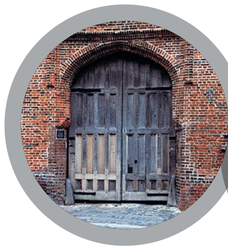
Реставрация исторических сооружений