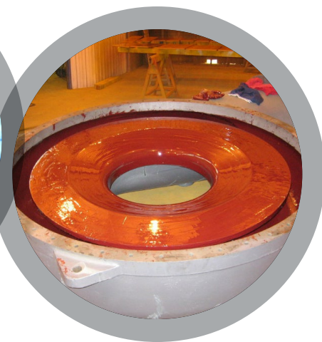
Посадочные места вентилятора