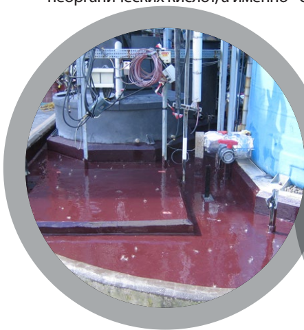
Обваловка химических хранилищ