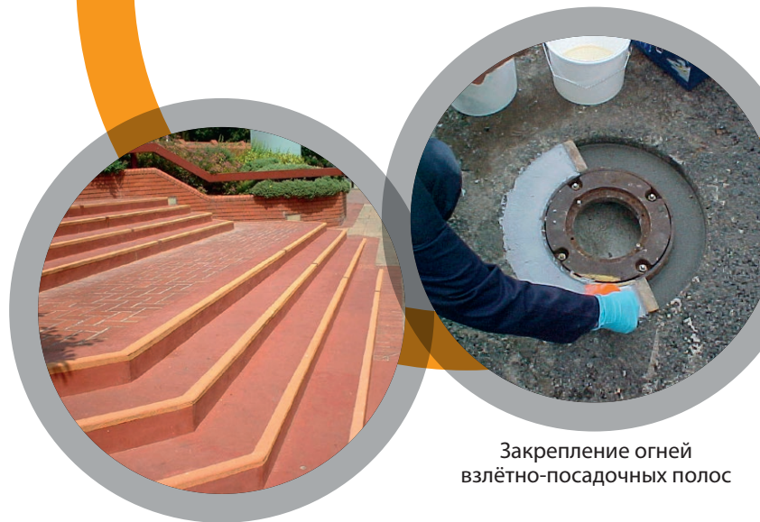
Закрепление огней взлётно-посадочных полос