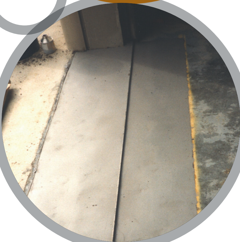
Проблемные участки пола

За более детальной информацией обратитесь к местному представителю Belzona: