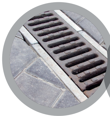
Стоки и решётки