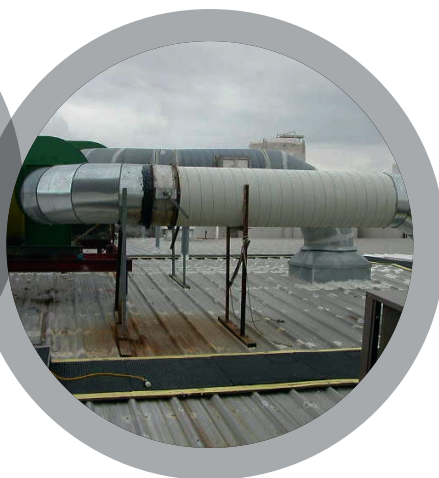
Газоотводы и вытяжные каналы