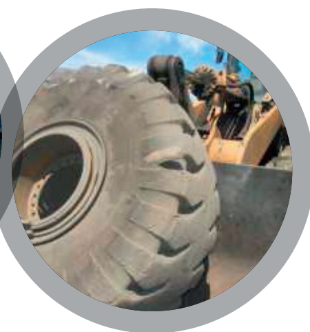
Ремонт боковин шин внедорожной техники