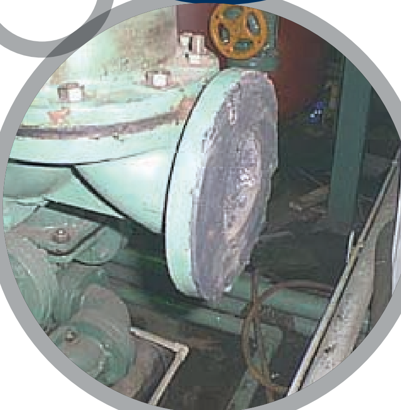
Межфланцевые резиновые прокладки

За дополнительной информацией обратитесь к: Belzona Технические характеристики продукта Belzona Инструкция по применению Belzona KNOW-HOW In Action