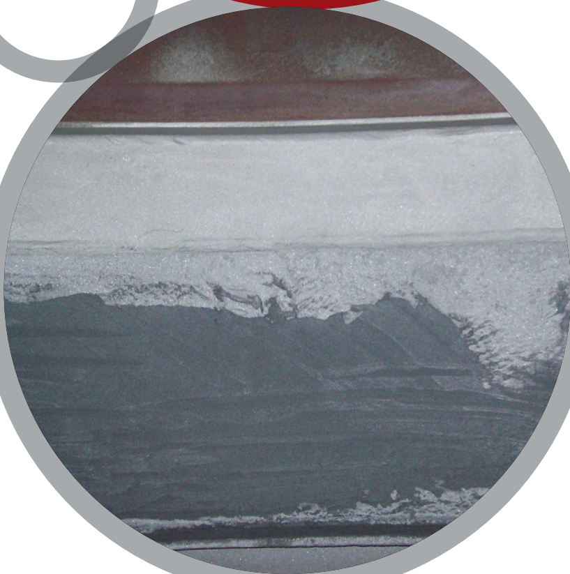
Внутренние стенки технологических емкостей

За более детальной информацией обратитесь к местному представителю Belzona: