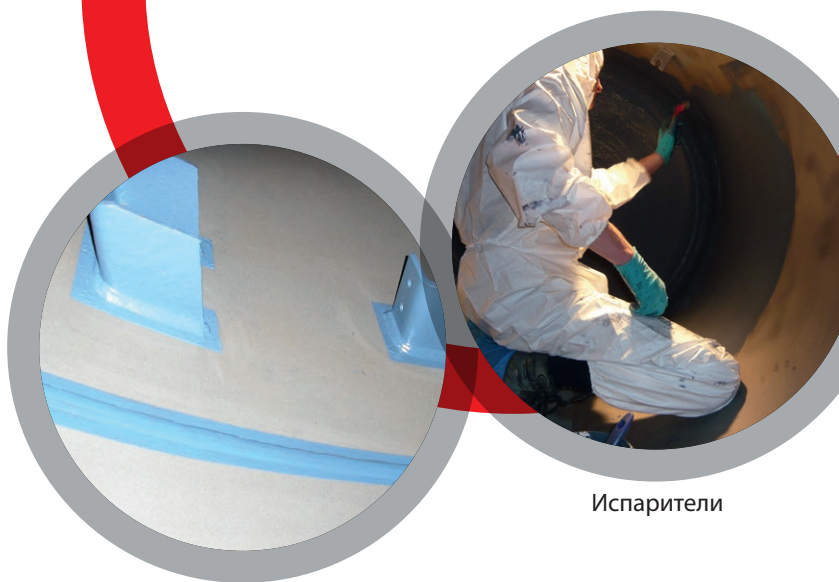
Сварные швы и скобки