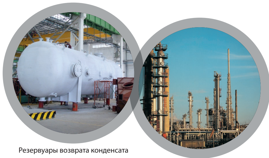
Резервуары возврата конденсата