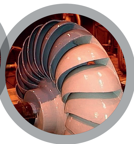
Рабочие колеса турбин