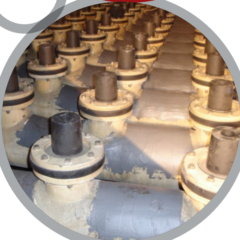
Установки десульфурации дымовых газов

За дополнительной информацией обратитесь к: Belzona Технические характеристики продукта Belzona Инструкция по применению Belzona KNOW-HOW In Action