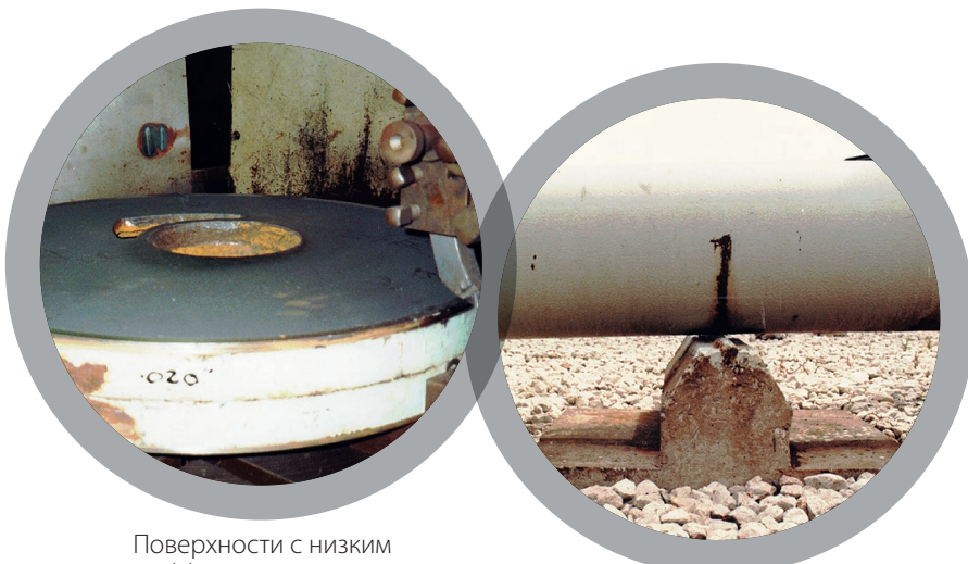
Поверхности с низким коэффициентом трения